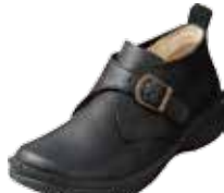
モンクストラップ 29,160円(税込)