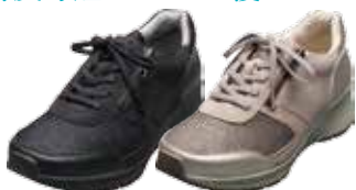
ウォーキングスニーカー 16,200円(税込)