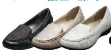
モカコンビ 15,120円(税込)