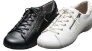
スニーカー スムース 15,120円(税込)