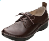
プレーントゥ 27,000円(税込)