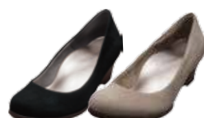
ウェッジパンプス スエード 17,280円(税込)