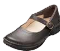
プレーンベルト 27,000円(税込)