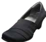
母趾フィットパンプス 15,120円(税込)

サイズ(共通) 22.0cm / 22.5cm / 23.0cm / 23.5cm / 24.0cm / 24.5cm / 25.0cm / 25.5cm