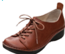
レースアップ 27,000円(税込)

サイズ(共通) 22.0cm / 22.5cm / 23.0cm / 23.5cm / 24.0cm / 24.5cm / 25.0cm