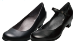
プレーンタイプ/ベルトタイプ 24,840円(税込)