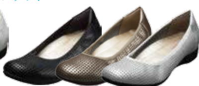
パンチング 15,120円(税込)

サイズ(共通) 22.0cm / 22.5cm / 23.0cm / 23.5cm / 24.0cm / 24.5cm / 25.0cm