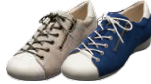
スニーカー キャンパス 15,120円(税込)